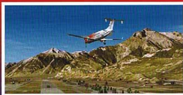
Flylogic's Sion - kleiner Airport in großer Kulisse