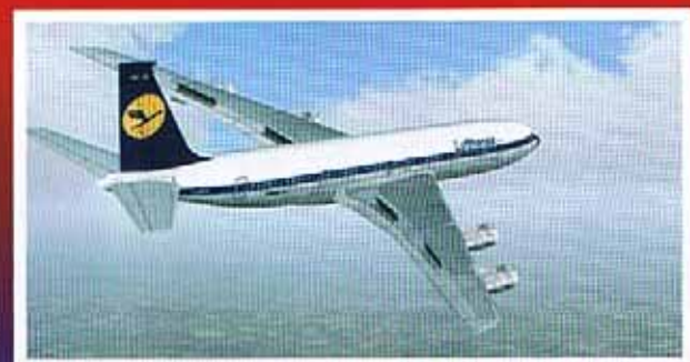
Die 707 von Captain Sim - die klassische Art zu fliegen